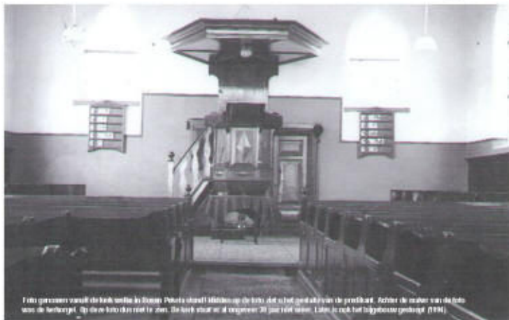
Foto gemaakt vanuit de kerk uit de Boven Pekela dorpskerk. Het is het oudste gebouw in de parochie. Achter de muren van de kerk was de herberg. Op deze foto draait de zwaaiende deurbalk van de kerk op de 14 september 2005 om 10.00 uur. Links is ook het kerkgebouw gebouwd (1934).