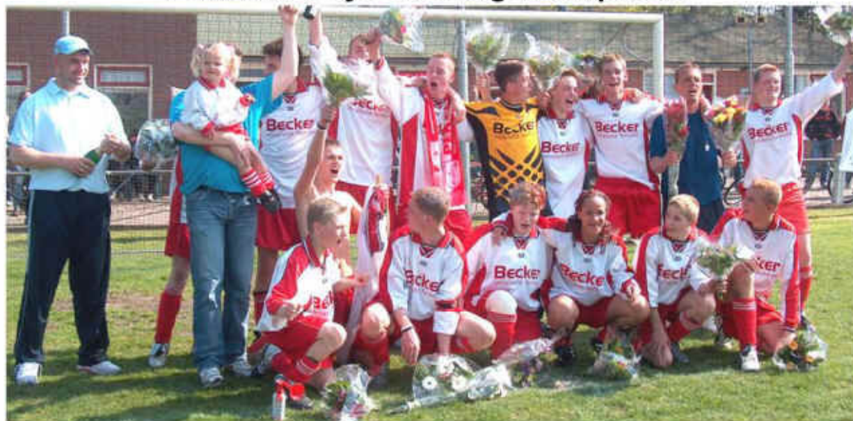
Het Pekelder Streekblad mag er dan geen aandacht aan besteden, maar wij doen het wel... en uitgebreid. De Pekelder Boys B1 jeugd van de plaatselijke voetbalvereniging is zaterdag 24 april jl. kampioen geworden van hun klasse. Verderop in dit nummer meer >>>