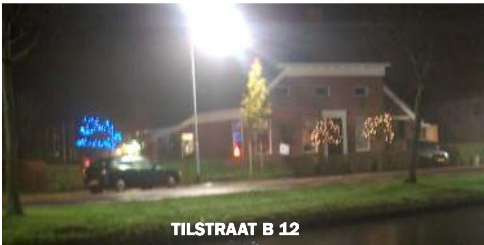
TILSTRAAT B 12