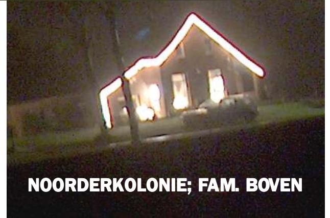
NOORDERKOLONIE; FAM. BOVEN