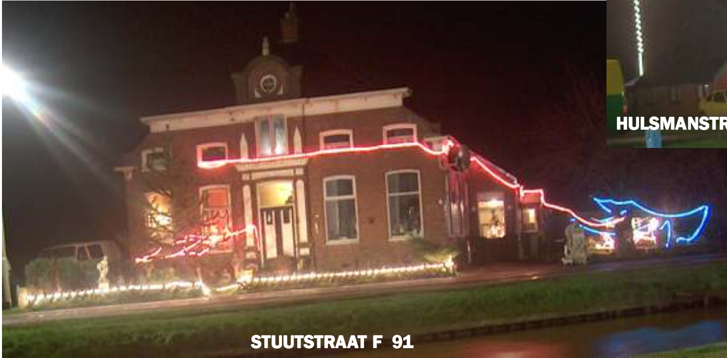
STUUTSTRAAT F 91

Het is weer december. De redactie heeft van doorsnee tot en met viaduct een selectie gemaakt van de mooist verlichte huizen