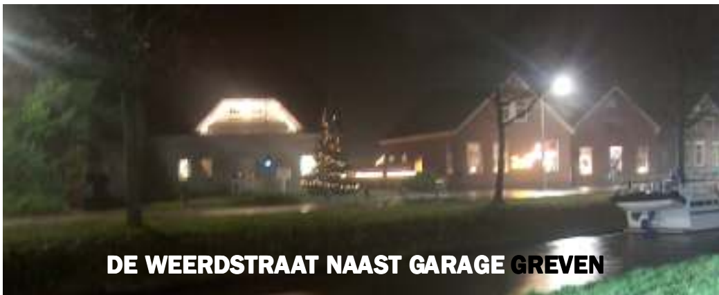
DE WEERDSTRAAT NAAST GARAGE GREVEN