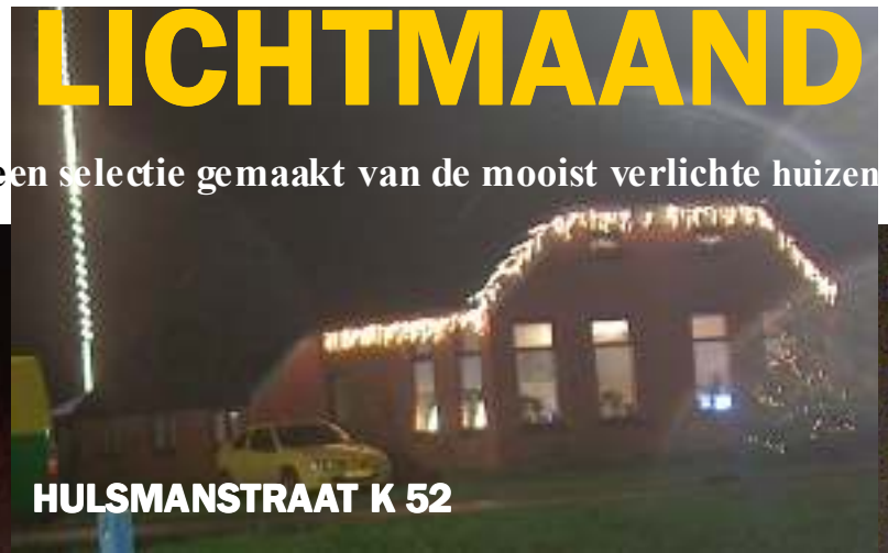
HULSMANSTRAAT K 52