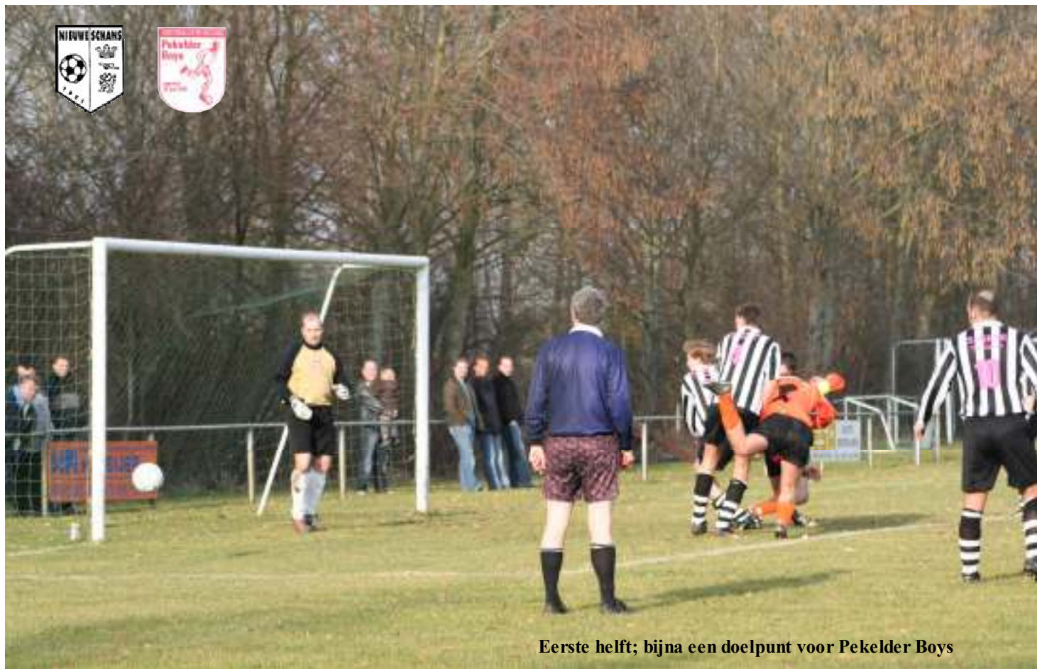
Eerste helft; bijna een doelpunt voor Pekelder Boys

Strijd om kampioenschap verder weg door verlies op oud en vervallen sportpark Nieuweschans; 1-0