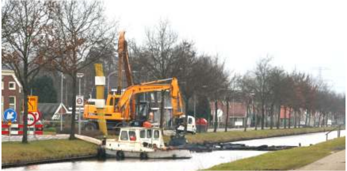
Half januari is eindelijk gestart met de uitbaggering van het Pekelder hoofddiep. Dit project startte in Boven Pekela bij de elektronisch bedienbare AG Wildervancksluis. Het is de bedoeling dat met tot en met Oude Pekela door gaat met het uitdiepen. Kosten: 5,6 miljoen euro.