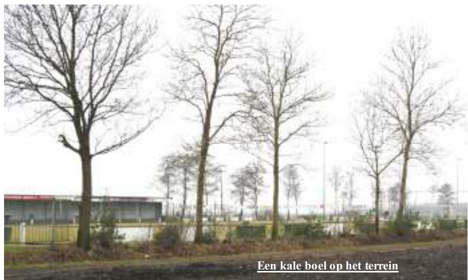
Een kale boel op het terrein